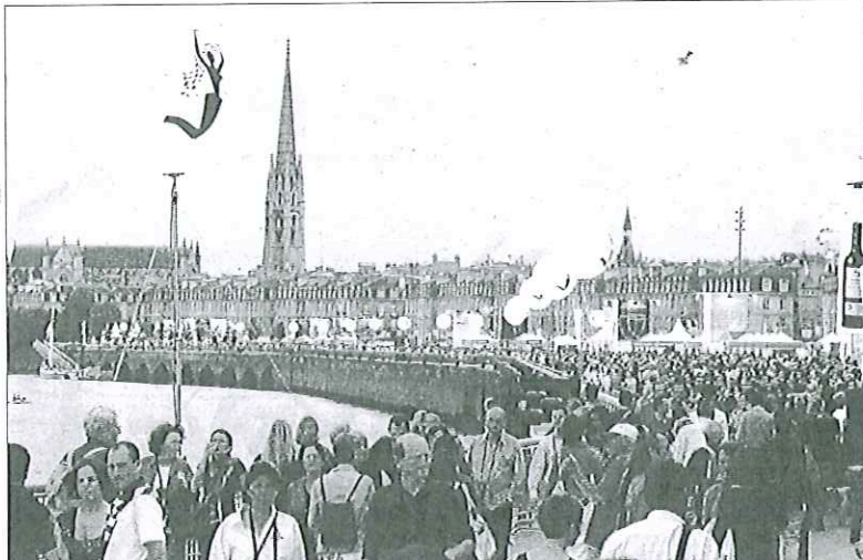
Il y a deux ans, la manifestation avait été une réussite. Cette année, les organisateurs prévoient une affluence record sur les quais de Bordeaux, en bord de Garonne.