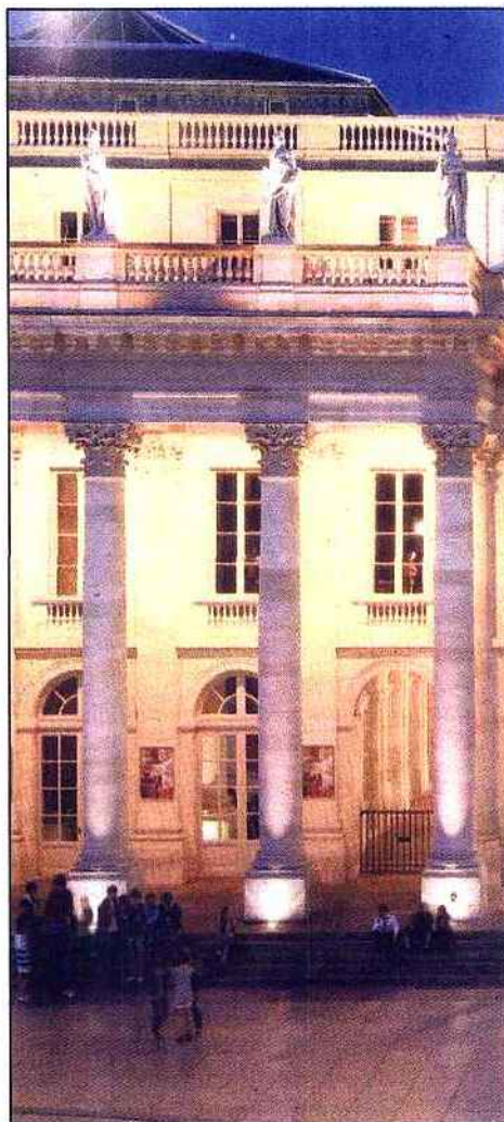
Le cours du Chapeau-Rouge, dans le centre-ville de Bordeaux.