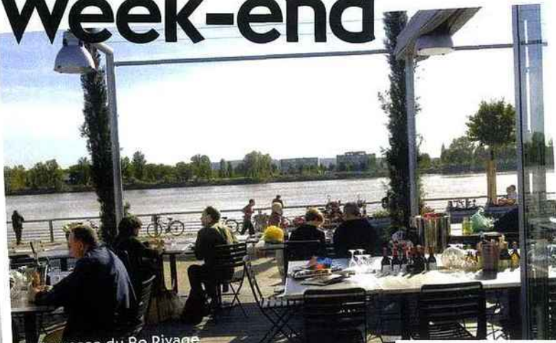
La terrasse du Bo Rivage sur le quai des Chartrons.